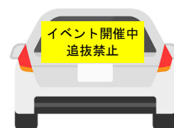
大会運営車両イメージ

大会運営車両はトンネルを出ると徐行（対向車のあるときは停止）し、右側の駐車帯に入ります。